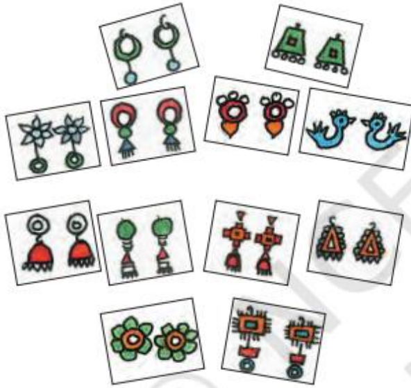
कान की बालियों की जोड़ियाँ